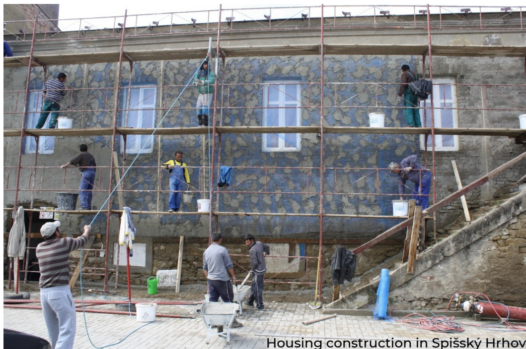
Housing construction in Spišský Hrhov

Bila so obdobja, ko smo zaposlovali več kot 100 zaposlenih, pripravili smo več kot 500 zazidljivih parcel po ugodnih cenah, zato so se v našo vas začeli seliti tudi ljudje iz regije. Podprli smo model financiranja gradnje družinskih hiš za samopomoč. Prebivalstvo se je začelo povečevati, ljudje so začeli graditi hiše.