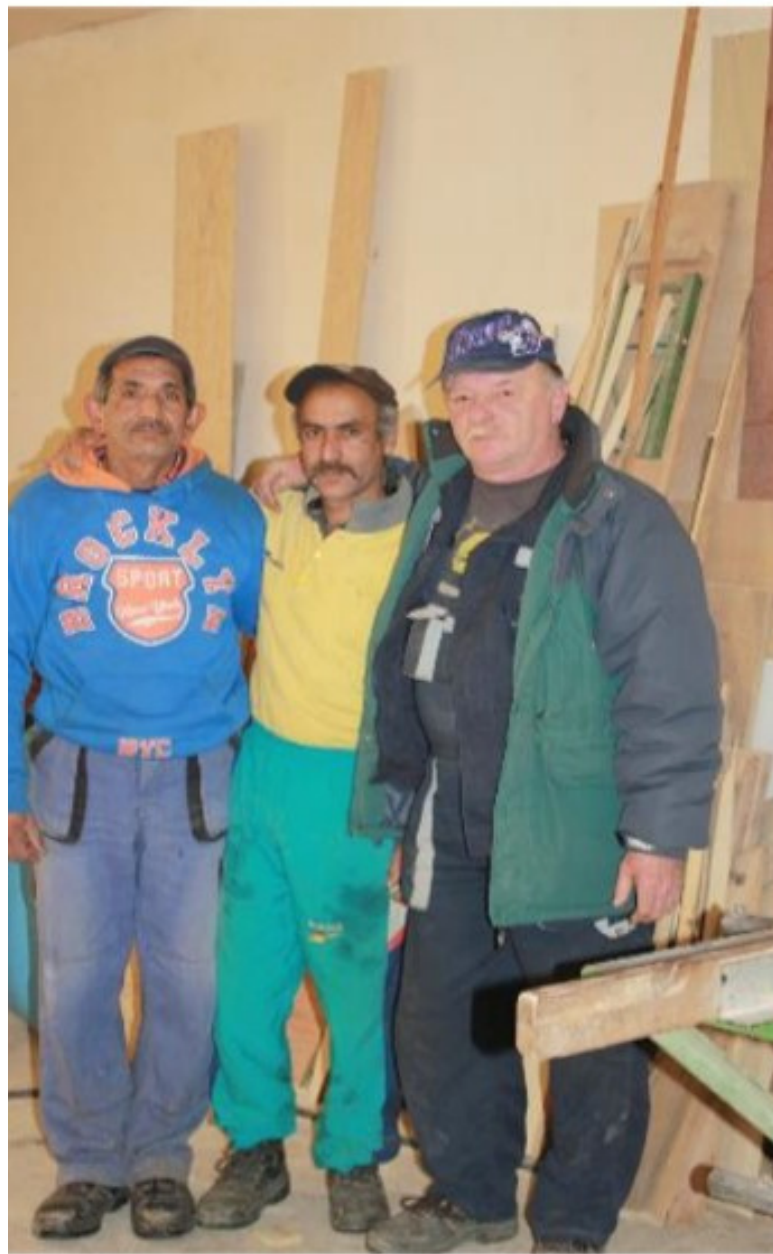
Πολίτες του Spišský Hrhov

Η βασική ιδέα ήταν η δημιουργία θέσεων εργασίας και η κοινωνική ένταξη της κοινότητας των Ρομά στη ζωή του χωριού.