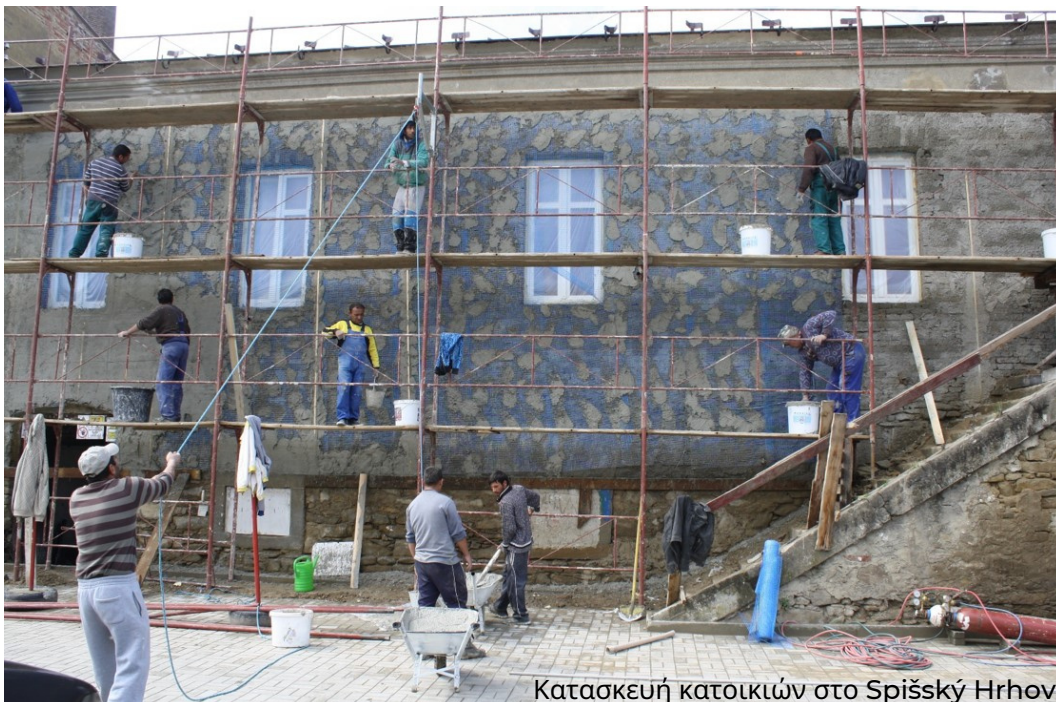
Κατασκευή κατοικιών στο Spišský Hrhov

Υπήρχαν περίοδοι που απασχολούσαμε περισσότερους από 100 υπαλλήλους, ετοιμάζαμε περισσότερους από 500 χώρους ανέγερσης κτιρίων σε προσιτές τιμές, οπότε και άνθρωποι από την περιοχή άρχισαν να μετακομίζουν στο χωριό μας. Υποστηρίξαμε το μοντέλο χρηματοδότησης αυτοβοήθειας αυτοβοήθειας για την κατασκευή οικογενειακών κατοικιών. Ο πληθυσμός άρχισε να αυξάνεται, οι άνθρωποι άρχισαν να χτίζουν σπίτια.