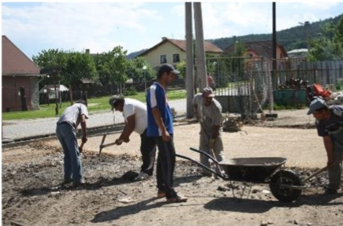
Πολίτες του Spišský Hrhov κατά τη διάρκεια οικοδομικών εργασιών

Την εποχή που καταχώρισαν την εταιρεία μας ως κοινωνική εταιρεία, είχαμε ήδη μια δημοτική επιχείρηση στην οποία απασχολούσαμε μειονεκτούντες πολίτες. Εξετάσαμε θα μπορούσαν να κερδίζουν τα προς το ζην μόνοι τους και αν ναι, τους απασχολούσαμε. Όταν γίναμε μια κοινωνική επιχείρηση, λάβαμε μια χορηγία για αυτούς που δεν λαμβάναμε παλαιότερα.