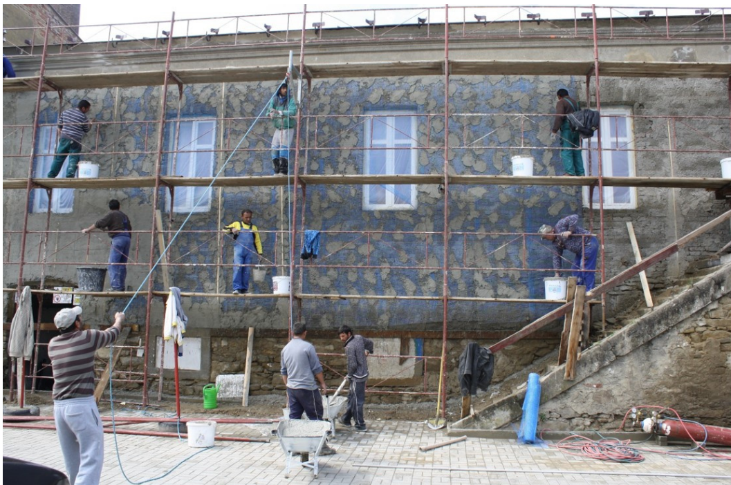
Talon rakennusta Spišský Hrhov:ssa

Pystyimme työllistämään jopa yli 100 työntekijää, jotka valmistelivat yli 500 tonttia rakennusvalmiiksi. Tontit olivat edullisia, mikä lisäsi muuttoliikettä lähiseudulta meidän kyläämme. Avustimme tässä perheiden rakennushankkeita rahoittamalla. Väestö kasvoi ja monet aloittivat talon rakentamisen.