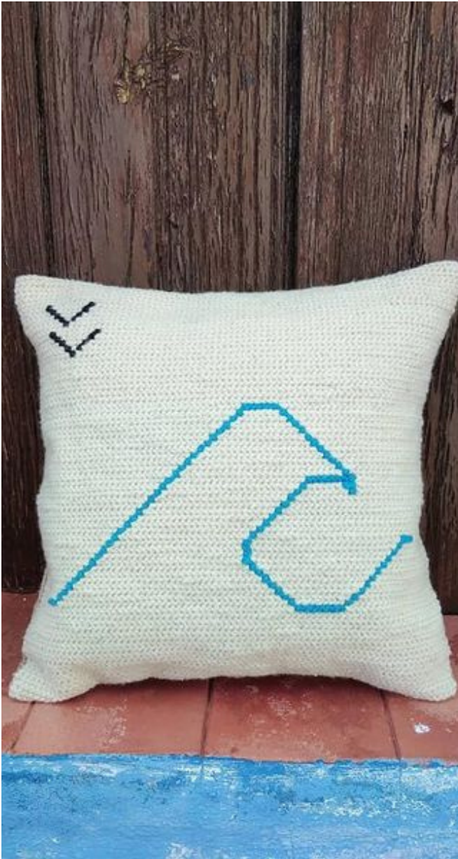
Criações de " O Senhor Almofada"

"Em Outubro de 2020 fui à RTP1 apresentar o Projecto no Programa "Praça da Alegria", já fui entrevistado para em várias Reportagens em Jornais, bem como para outros Programas na RTP e SIC!"