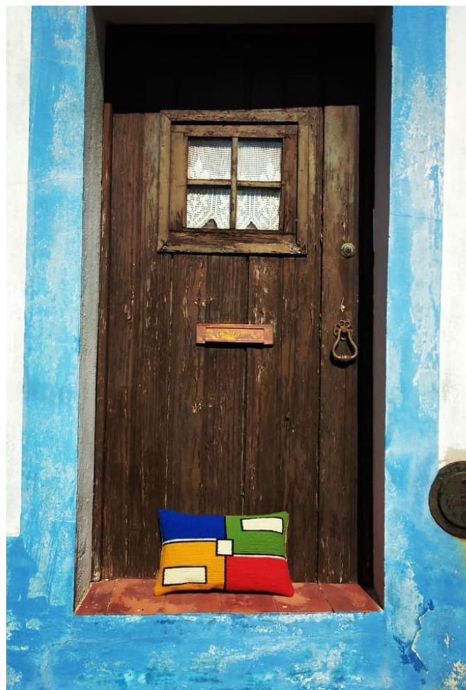
Criações de "O Senhor Almofada".

"Comecei lentamente a equacionar se não deveria levar mais a sério este projeto. E em Setembro de 2020 em conversa com uma amiga norte-americana que vive em Lisboa e que trabalhou em Arte em Los Angeles, disse-me que adorava as minhas almofadas, que os padrões e cores eram muito bonitos e que podia vender. Nesse mesmo dia decidi criar um perfil só para o projeto e em 5 minutos inventei "O Senhor Almofada", ainda equacionei em Inglês mas quis manter na nossa língua por respeito a uma tradição antiga ."