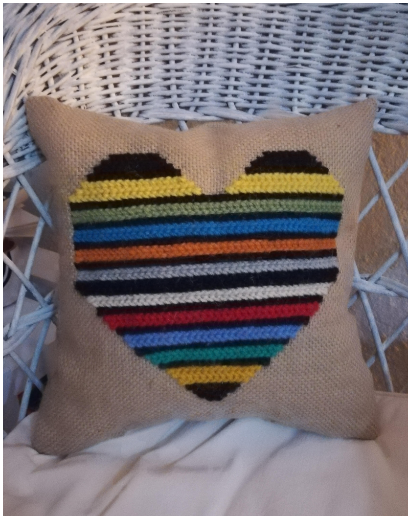
Μία από τις δημιουργίες του Nuno Rosa

«Έχοντας πολύ ελεύθερο χρόνο, παρακολούθησα ένα εργαστήριο για τη βελονιά Αραιόλο, ένα θέμα-αντικείμενο για το οποίο μία φίλη που έχει κατάστημα με χαλιά με είχε προκαλέσει να ασχοληθώ εδώ και χρόνια. Αρχικά κέντησα ένα κάδρο 20x20, αλλά επειδή μου άρεσαν τα μαξιλάρια αντί των χαλιών, άρχισα να κεντώ αλλά με μοτίβα που δημιούργησα εγώ και με τα χρώματα που μου άρεσαν περισσότερο».