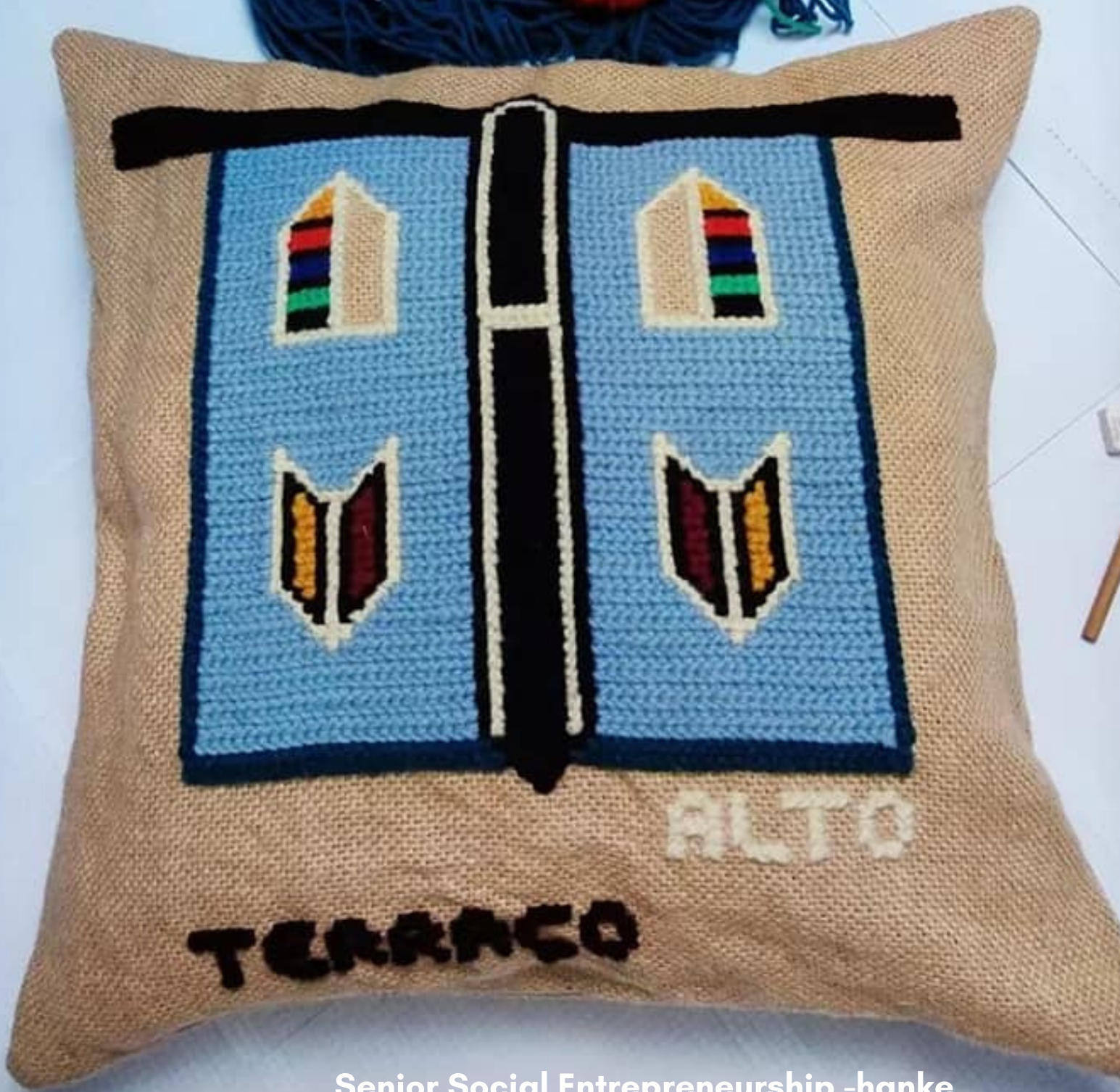
Senior Social Entrepreneurship -hanke